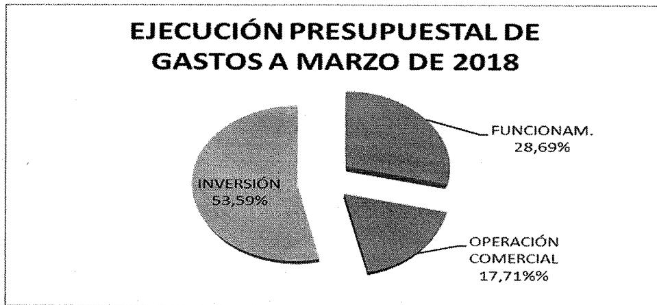
Gráfico No. 02